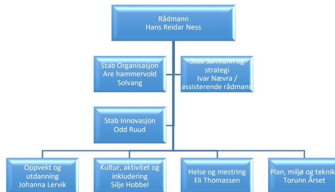
Figur 2: Organisasjonskart nye Moss.

Organisasjonskart med de fire kommunalområdene for nye Moss er vist i figur 2.